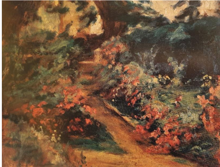
Paisaje. Colección privada.